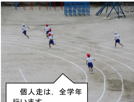
個人走は、全学年行います。