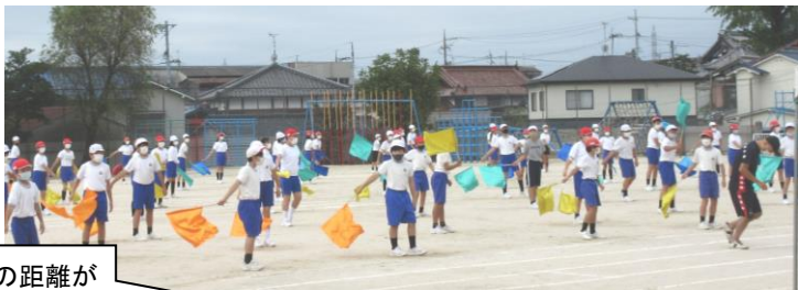
表現は、隣との距離が保ちやすくなるよう、道具をもつなど工夫して行います。（2・3・6年生）