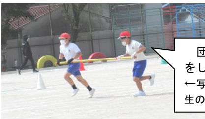
団体競技は、密にならない工夫をします。（1・4・5年生） ←写真は、2人で手袋をして行う5年生の台風の日