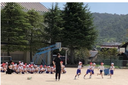
個人走は全学年行います。低学年は直線、3年生以上はトラックを走ります！