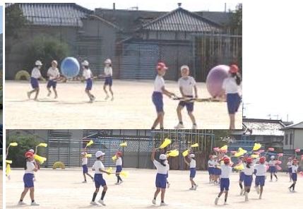
団体(1・4・5年)表現(2・3・6年)は密を避ける工夫をして行います。