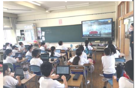
自分たちの演技を動画で見て、次の目標をたてる6年生

限られた運動場という空間の中で、547名の児童とその保護者の皆様が、密集・密接を避けながら安全に運動会を行うために、教職員一同、知恵をしぼって取り組んできました。