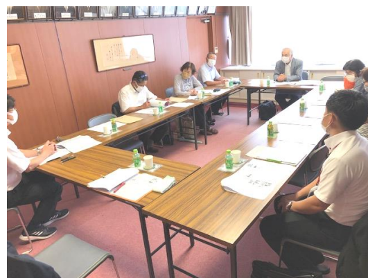
保護者アンケート

9月15日(木)に今年度第二回学校運営協議会を行いました。熊野町教育委員会からもコミュニティスクールの説明がありました。その後、授業参観をしていただき、子供たちの頑張っている様子を見ていただきました。懇談では、保護者アンケート等を基にした学校評価中間報告(後日ホームページに掲載)を行いました。また、全国学力・学習状況調査の結果及び分析、読解力の向上、感謝する心の育成、150周年記念行事等が話題となり、運営協議会として学校の教育活動充実に協力していくと話をしてくださいました。保護者アンケートの結果も踏まえ、今後もしっかりと学校運営を行ってまいります。