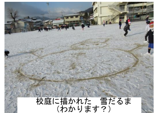
校庭に描かれた 雪だるま (わかります?)