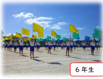
6年生 6 Gift