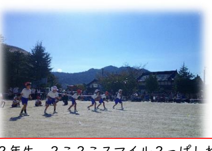
2年生 2こ2こスマイル2っぱしれ