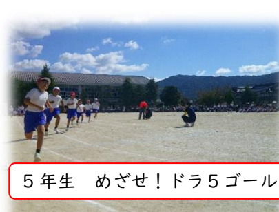
5年生 めざせ!ドラ5ゴール