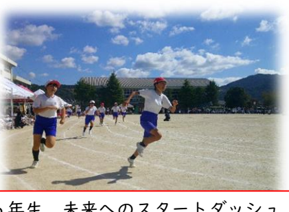
6年生 未来へのスタートダッシュ!