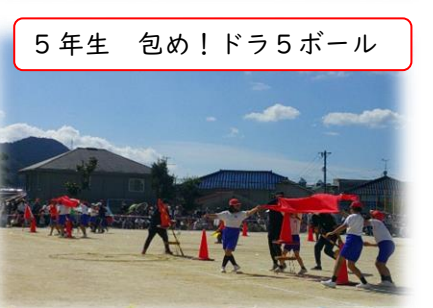
5年生 包め!ドラ5ボール