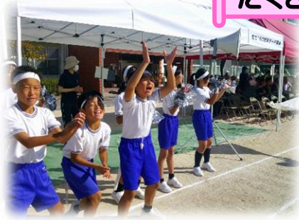
1年生 よっしゃ!やってみよう!