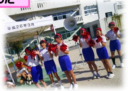
3年生光陰“三本の矢”の如し