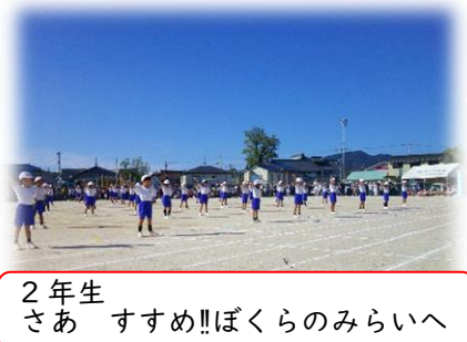
2年生 さあ すすめ!!ぼくらのみらいへ