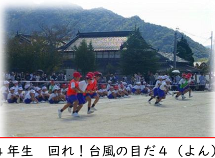
4年生 回れ!台風の目だ4 (よん)